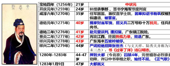
勾勒诗人坎坷的一生 风雨飘摇的时代 写作背景直观