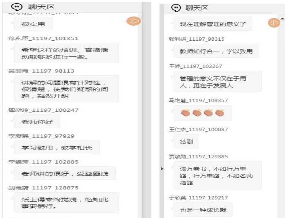
——老师们深受鼓舞，收获满满——